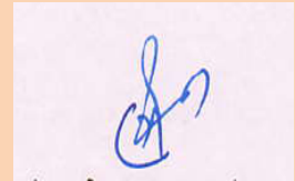
(लक्ष्मीकान्त बालोत) आयुक्त नगर निगम, भरतपुर